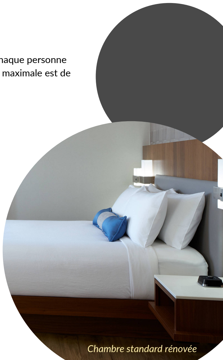
Chambre standard rénovée